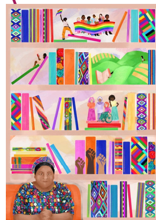
4 e prix - Anne-Sophie Girault « Lutter pour lire, lire pour lutter »