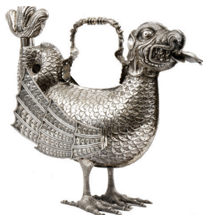
«Caquesseitão», Aquamanil Sud-ouest asiatique - XVII e siècle