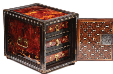
Cabinet Taca Guzarat, Inde, Province du nord de l'Etat portugais - XVII e siècle