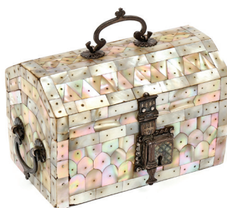
Coffret Guzarat, Inde - XVII e siècle