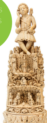
Enfant Jesus Bon Pasteur Indo-portugais - XVII e siècle