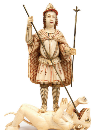
Saint Georges / Saint Michel terrassant le Dragon Indo-portugais, Goa - XVII e siècle