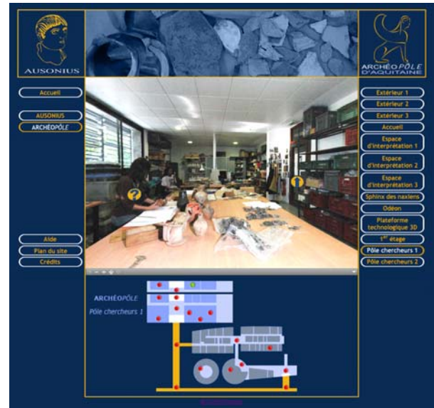
Page d'accueil de la visite virtuelle.