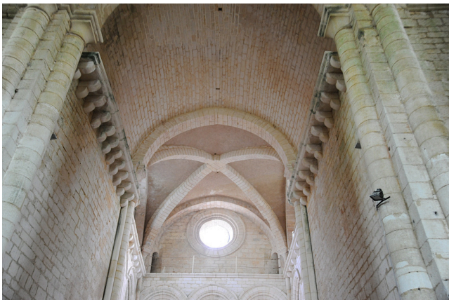
Voûte de l'église de Saint-Amand-de-Coly (24)

La désignation des styles « roman » et « gothique » a souvent masqué, par son effet de simplification, la complexité et la richesse des formes et de la création, que ce soit dans le domaine de l'architecture ou des arts de l'image et du décor. L'enjeu des communications de ce samedi est d'ouvrir la réflexion au-delà de ces schémas convenus et de raisonner à partir d'observations objectives, dans un cadre chronologique précis, souvent défini comme une phase de « transition » entre ces deux périodes stylistiques, c'est-à-dire la fin du XII e siècle, alors que le duché d'Aquitaine est placé sous l'autorité des Plantagenêts.