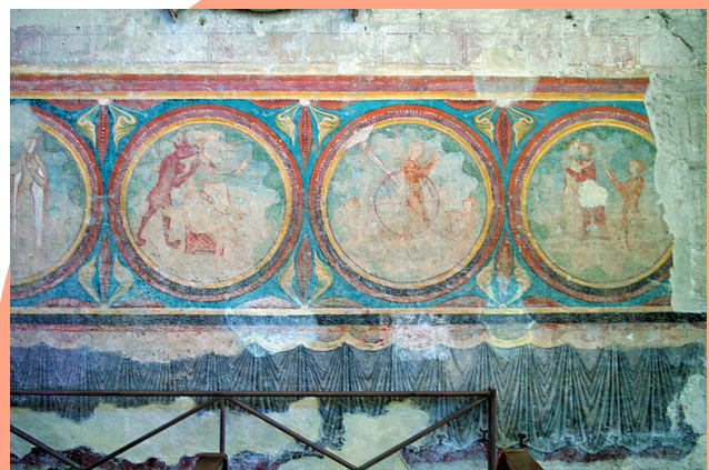
Peintures murales Saint-Emilion (17)

Les sociétés savantes de Nouvelle-Aquitaine sont invitées à présenter leurs activités et associations sous forme de salon.