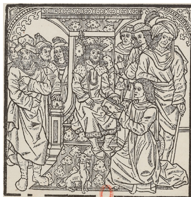
Guerin de Montglave , éd. Michel Le Noir, Paris, ante 1518