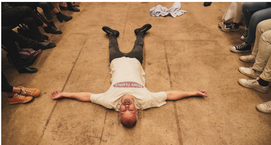
La lune, si possible