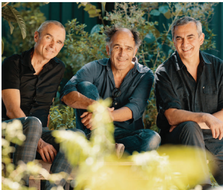
L'intranquillité de Fernando Pessoa