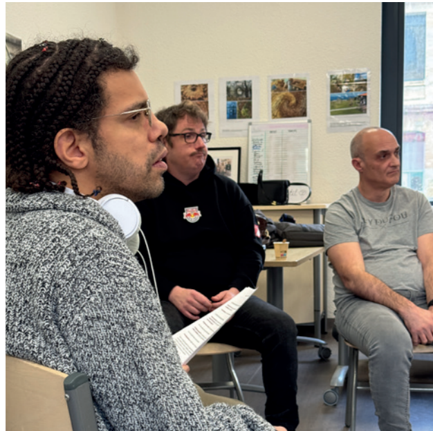
Les rédacteurs d'Inside très attentifs aux propos de notre invité.

plus efficace, la plus chouette de partager ce que l'on a compris. Mais d'abord, il faut être curieux et poser des questions.