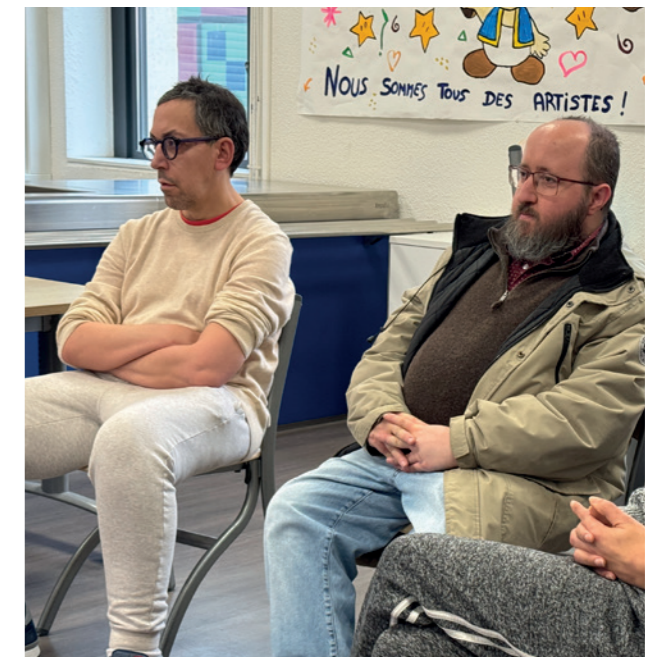
On se laisse captiver...

Comme j'avais plutôt bien réussi, le patron du groupe de presse allemand qui portait ce titre, me proposa de travailler pour Voici et Gala . J'ai dit oui mais je m'en suis mordu les doigts. Les sujets traités ne m'intéressaient pas, c'était éloigné de mes centres d'intérêt. Ces titres parlaient surtout de la mode, des royautés, des gens de la télé et je n'y connaissais rien. J'étais tellement mal à l'aise là-dedans qu'au bout d'un an et demi, j'ai eu un infarctus. Je suis allé à l'hosto et j'ai arrêté mon histoire avec Voici et Gala . Le seul truc positif à retenir, c'est que je suis le seul ancien directeur du Monde à avoir dirigé Voici et Gala .