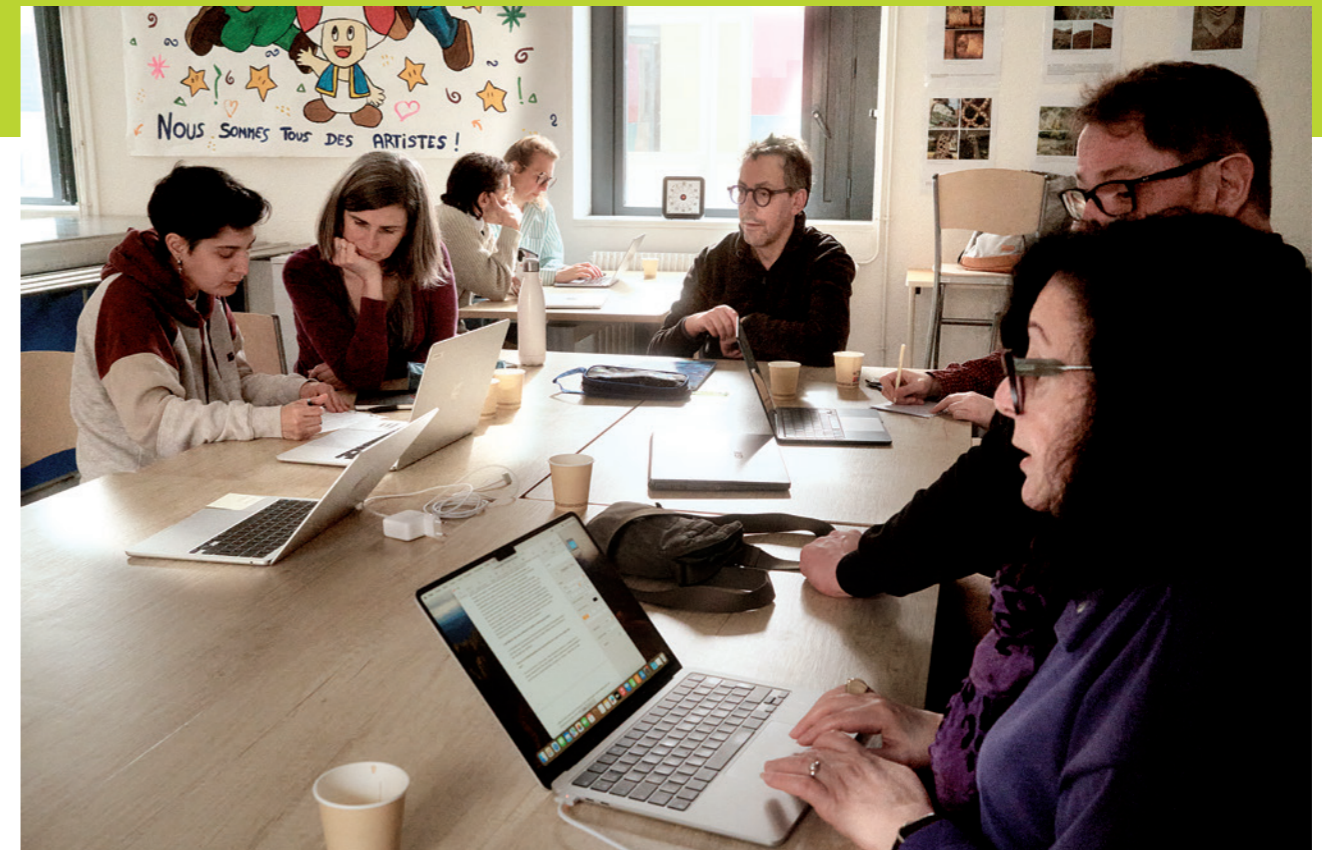
La rédaction d'Inside.

D. P. – Souvent, ce qui marche bien, c'est de commencer à faire parler les interviewés sur leur actualité, l'album ou le livre qu'ils viennent de sortir par exemple... On commence par le plus chaud, parce que là-dessus, ça va être facile pour eux. Après, vous pouvez leur poser d'autres questions plus personnelles. Déjà, vous mettez un peu en perspective, vous leur faites raconter leur parcours et les personnes commencent à se livrer. C'est cela qui est intéressant. Il ne faut pas avoir peur de poser des questions simples. Même si c'est personnel. Si vous interviewez un artiste que vous aimez par exemple, il faut oublier que vous êtes un fan. Un fan ne pose pas de bonnes questions. Celui qui pose des bonnes questions, c'est celui qui a pris un peu de recul. Enfin, il est très important de préparer une interview, d'avoir un ordre des questions. Une fois qu'on a fini l'article, la première chose à faire, c'est de dire à son collègue, « Tiens, tu lis mon papier, tu me dis ce que tu en penses . » Une équipe de rédaction, ça sert à ça aussi !