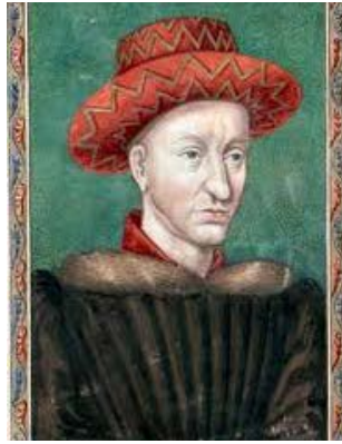
Portrait de Charles VII, d'après Jean Fouquet, Paris, BnF, Album de Gaignières, Est. Oa 14 f. 3.