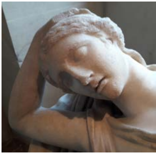
Femme endormie (détail), musée du Louvre, Ma 380.