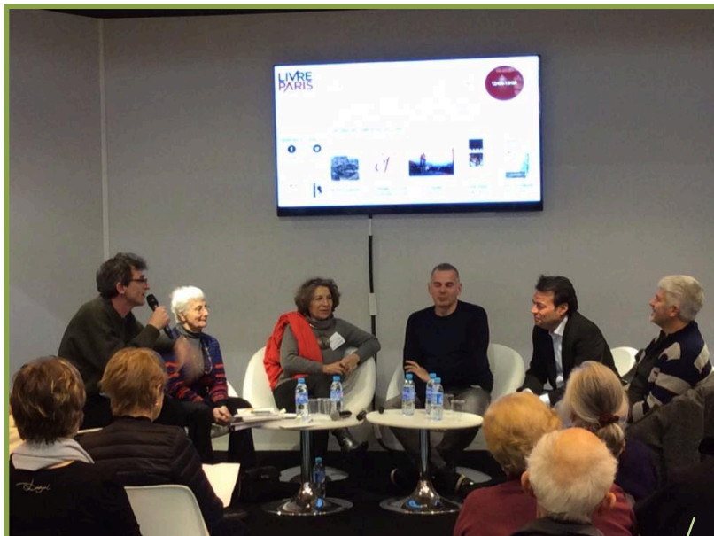
Conférence "Comment les découvertes archéologiques changent le cours de l'histoire".