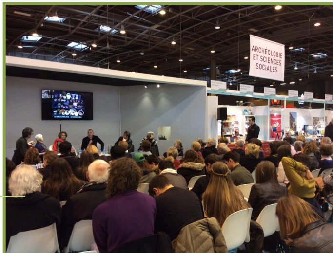
Un public nombreux et attentif était au rendez-vous.