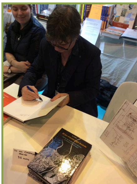
Tout comme Luc Long et ses dessins originaux